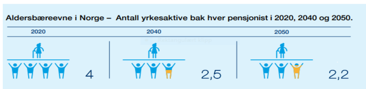
Figur 1.

I tilknytning til helsesamarbeidet er det utarbeidet et bærekraftsdokument som skal være retningsgivende for regionens helsesamarbeid. Dokumentet ligger vedlagt (vedlegg 1), og tar utgangspunkt i nasjonale føringer innenfor bærekraft og helse.